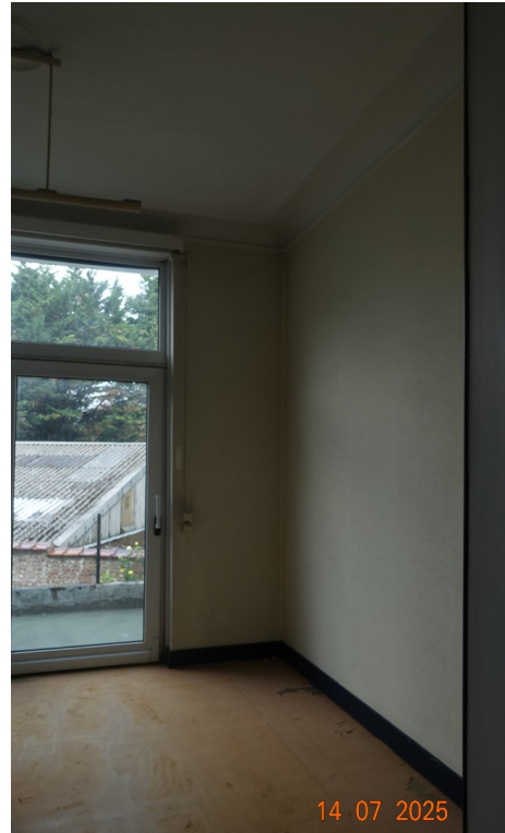
30. Cabinet kiné (exi, pièce arrière)

◀ Moquette : supprimée Moulures de plafond : conservées (si possible techniquement) Corniche de plafond : conservées (si possible techniquement) Cimaises murales : déposées en vue de leur réemploi ailleurs dans la maison Relief de bas de mur (carton moulé) : présent sur le mur de gauche mais pas sur le mur de droite. Déposés en vue de leur réemploi ailleurs dans la maison.