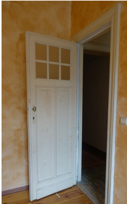
20. Porte 2ème étage Plaque de serrure manquante.