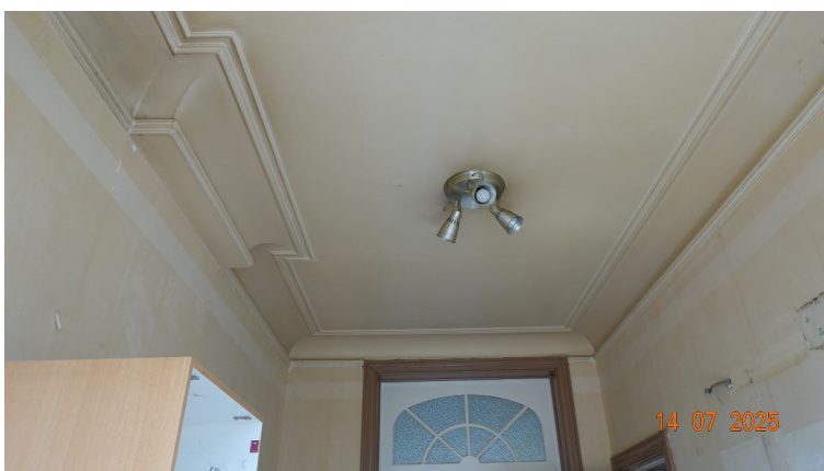
34. Plafond de la cuisine