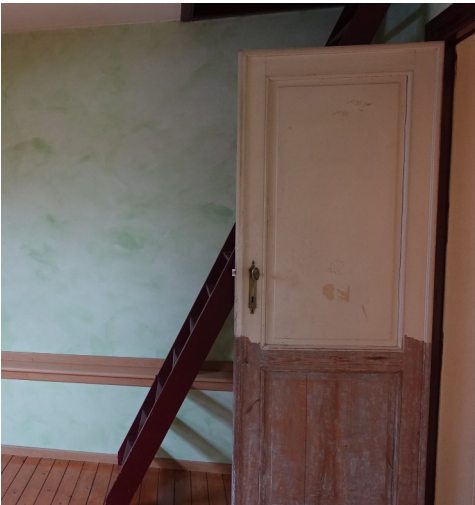
16. Porte du bureau 1 (PRO) Porte semi décapée.