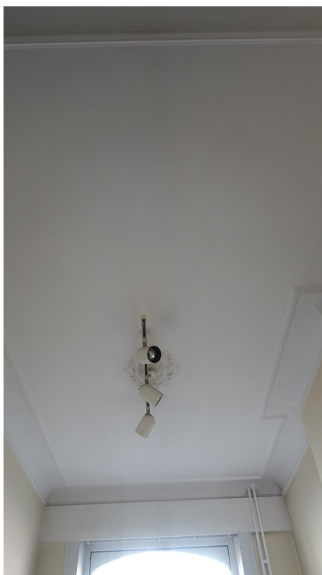
23. Plafond du bureau (existant)