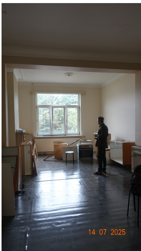
35. Salle à manger – salon