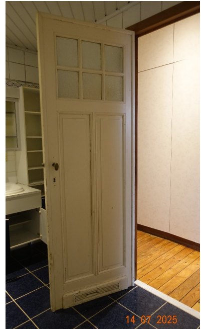
21. Porte 2ème étage Porte déplacée et raccourcie par les anciens propriétaires