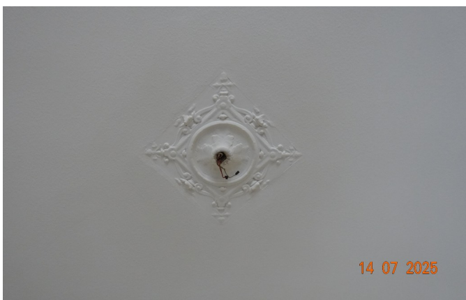
36. Rosace de plafond