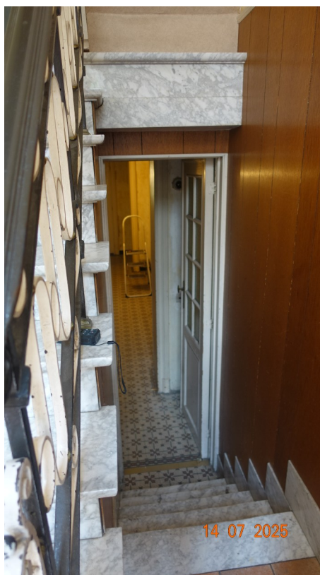
2. Volée vers cave

Marbre : conservé Garde-corps : conservé Lambris : supprimé Carrelage terre cuite : supprimé