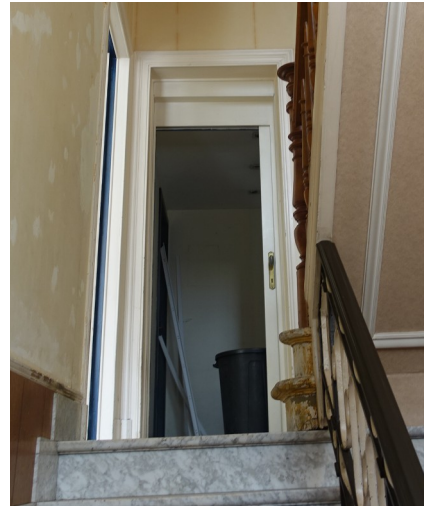
18. Porte bel étage Porte remplacée et ébrasement modifié.