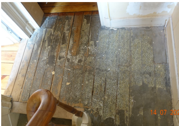
10. Sol du palier du 2ème étage

Double portes avec imposte vitrée : conservées et restaurées Balustre et main courante en bois : conservées Marches d'escalier : L'objectif est de retrouver l'état du bois naturel, si ce n'est pas possible les marches seront repeintes.