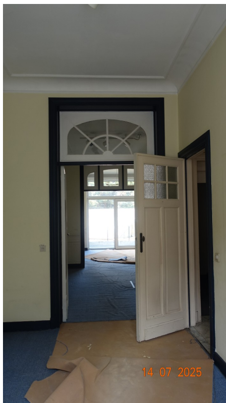
22. Bureau (existant)