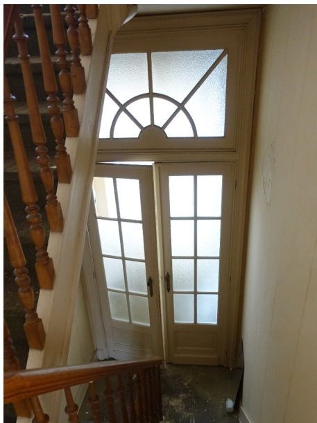
8. Paliers des entre-étages