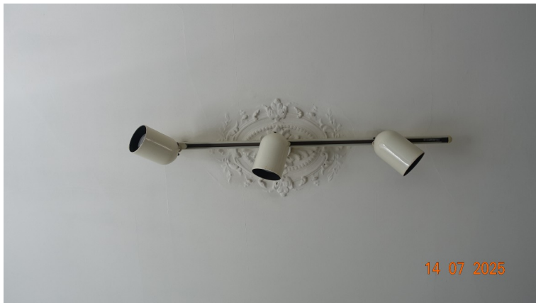
24. Rosace de plafond du bureau (existant)