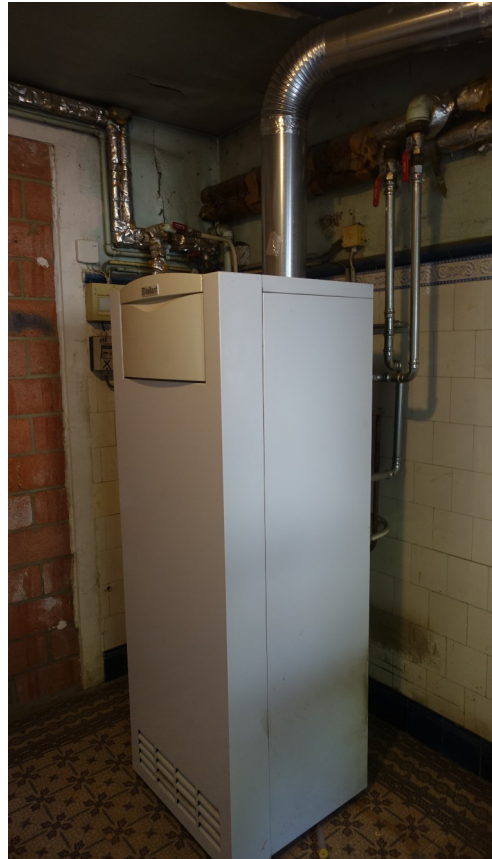
54. Installation technique existante