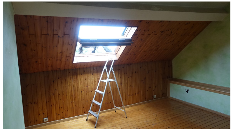
44. Mansarde (Bureau 1 projeté)

◀ ▲ Lambris (non d'origine) : supprimés Planchers : conservés et restaurés