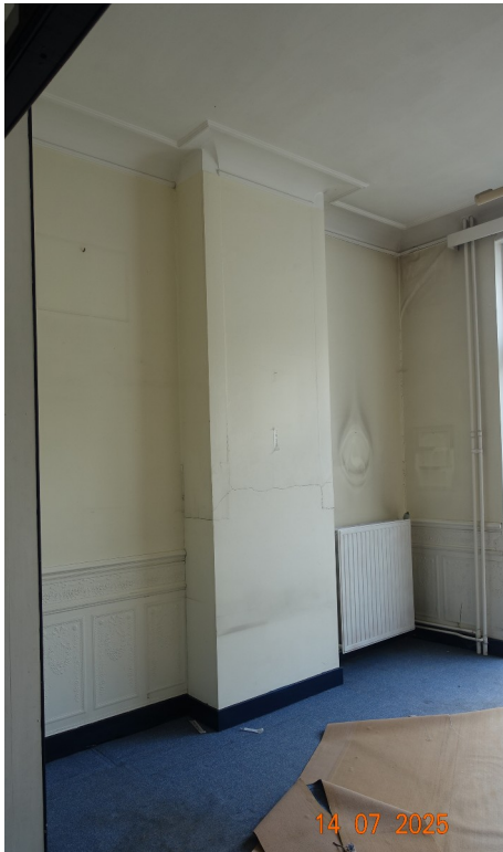
29. Cabinet kiné (exi, pièce arrière)

◀ Moquette : supprimée Moulures de plafond : conservées (si possible techniquement) Corniche de plafond : conservées (si possible techniquement) Cimaises murales : déposées en vue de leur réemploi ailleurs dans la maison Relief de bas de mur (carton moulé) : présent sur le mur de gauche mais pas sur le mur de droite. Déposés en vue de leur réemploi ailleurs dans la maison.