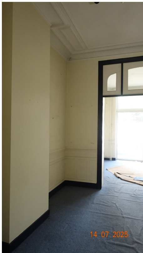
27. Cabinet kiné (exi, pièce centrale)

Moulure et corniche en plâtre de plafond et corniche : conservées (si possible techniquement)