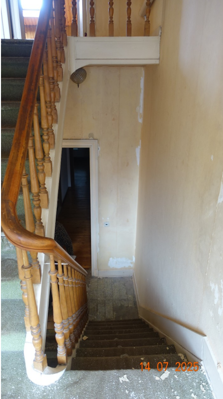
13. Dernières volées