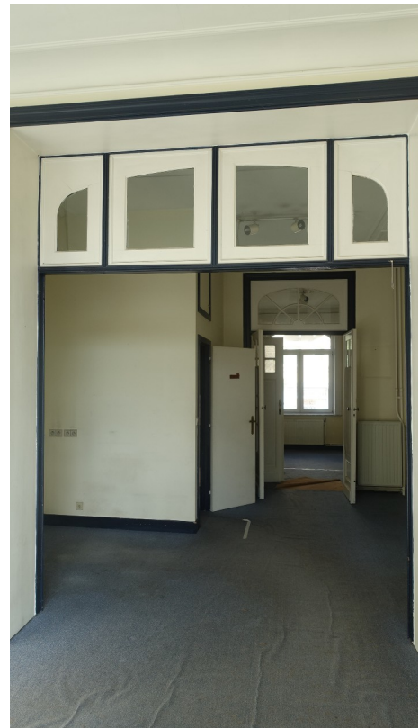
28. Cabinet kiné (exi, pièce centrale)

Relief de bas de mur : déposés en vue de leur réemploi ailleurs dans la maison