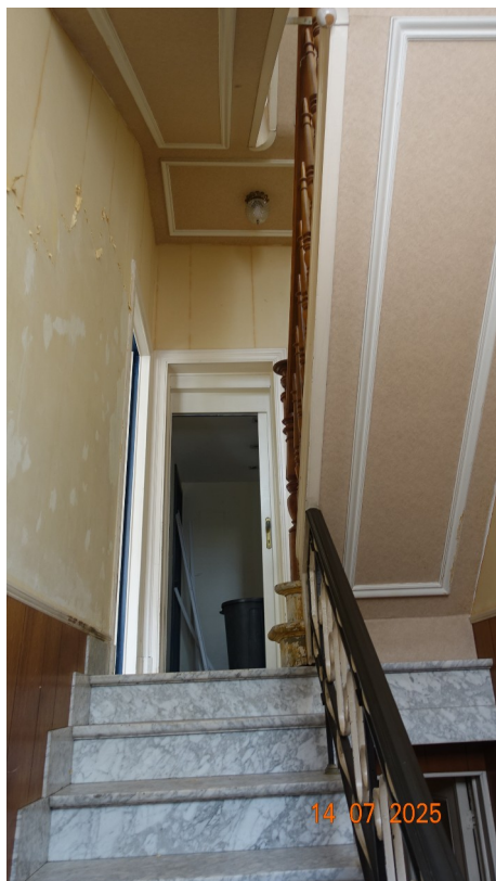
4. 1er palier

◀ Marbre : conservé Garde-corps : conservé Lambris : supprimé Cimaise de plafond : conservées Moulures sur paillasse d'escalier : conservées