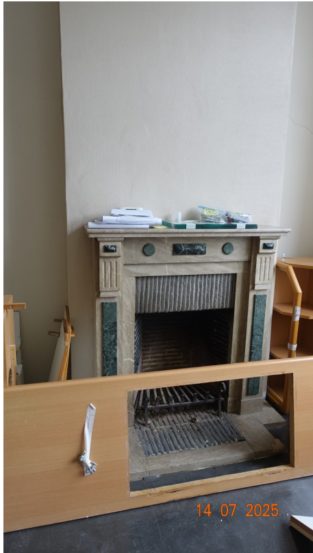
37. Cheminée du salon