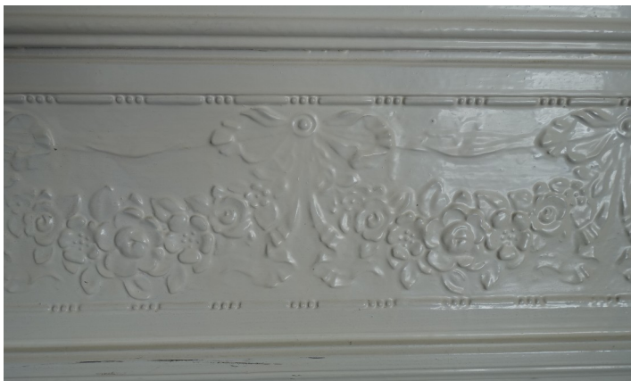
31. Décors de bas de mur cabinet kiné