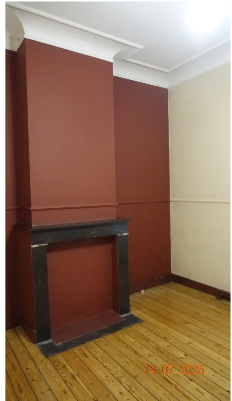
42. Chambre 1 (exi.)

Corniche de plafond : conservées sur trois murs et ajout d'une nouvelle moulure sur meuble haut