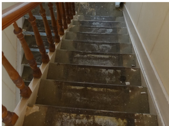
11. Marches d'escalier