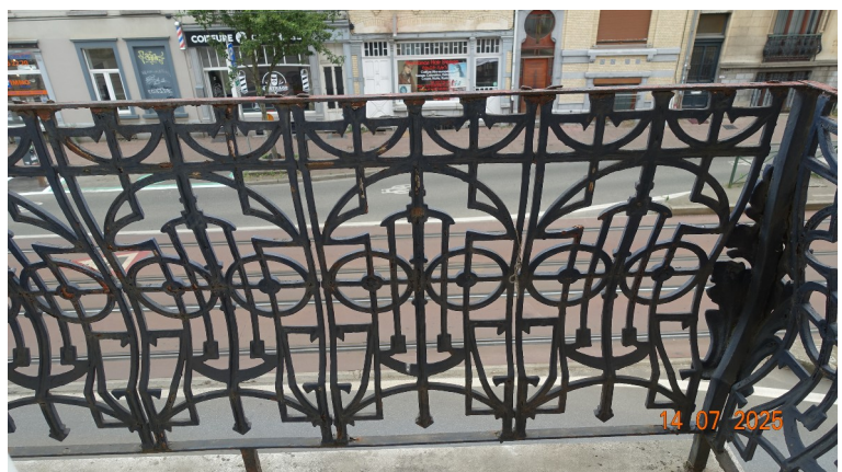
40. Garde-corps balcon