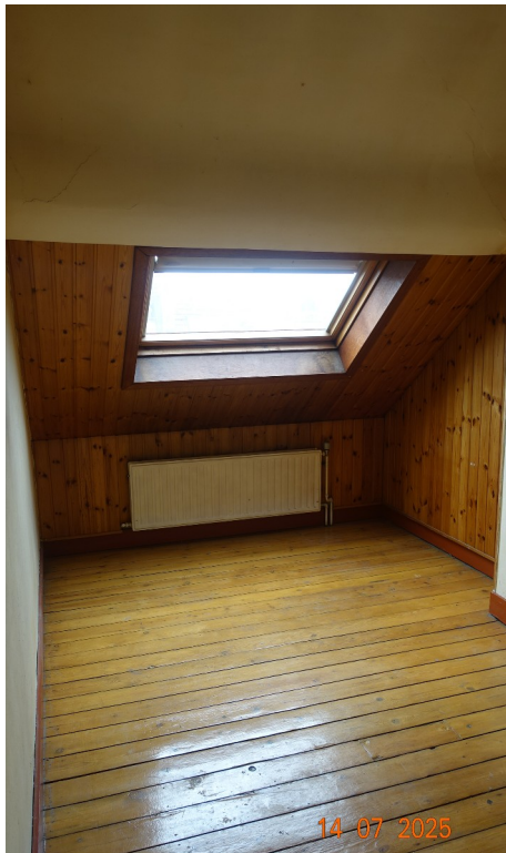
43. Mansarde (Bureau 2 projeté)