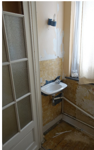
17. Porte palier entre étage Carreaux manquants.