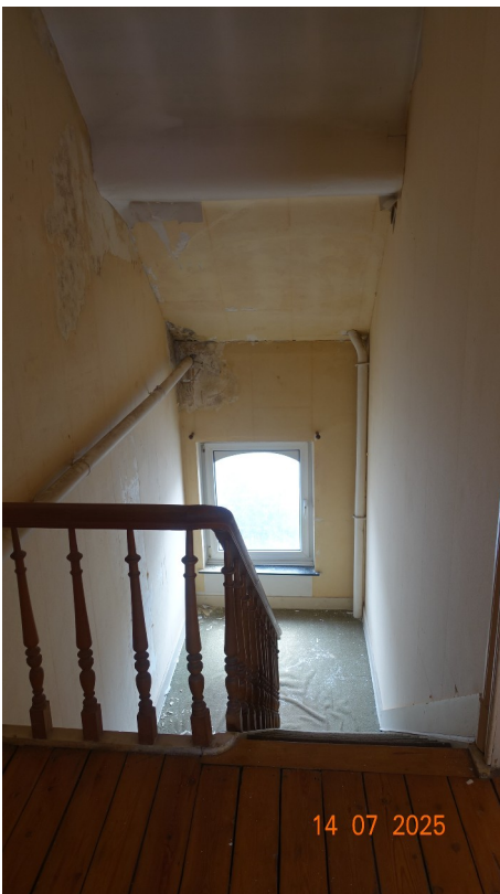
15. Dernier palier