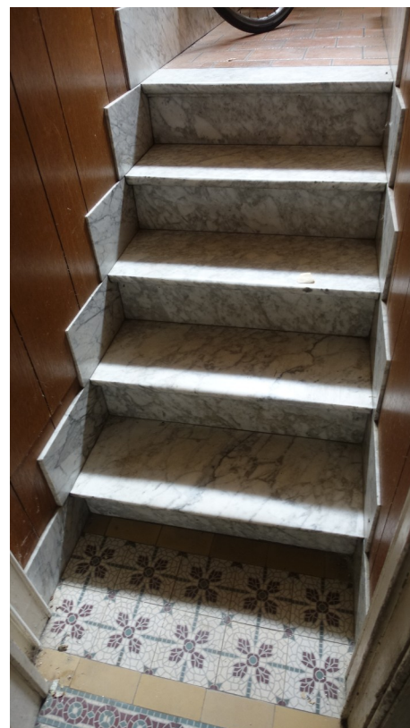
3. Volée vers cave

Marbre : conservé Garde-corps : conservé Lambris : supprimé Carrelage terre cuite : supprimé Porte : conservée Carreaux de ciment : conservés