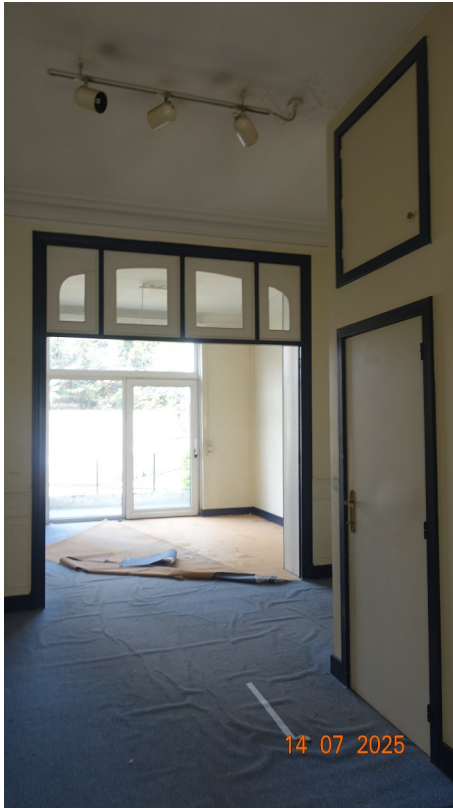
25. Cabinet kiné (existant)