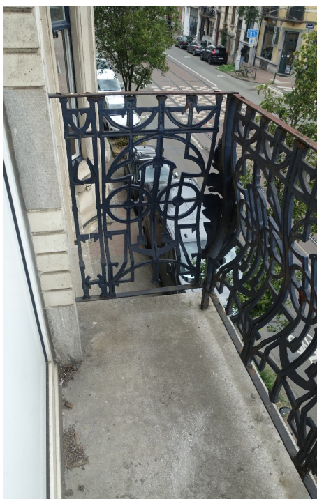
39. Garde-corps balcon

Manteau de cheminée : bien que ce décors de cheminée ait été déplacé de la pièce centrale à la pièce côté jardin par l'ancien propriétaire, le projet prévoit de le conserver et d'y intégrer une cassette