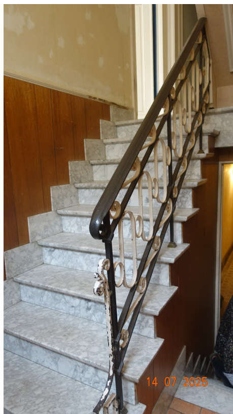
1. 1ère volée

Marbre : conservé Garde-corps : conservé Lambris : supprimé Carrelage terre cuite : supprimé