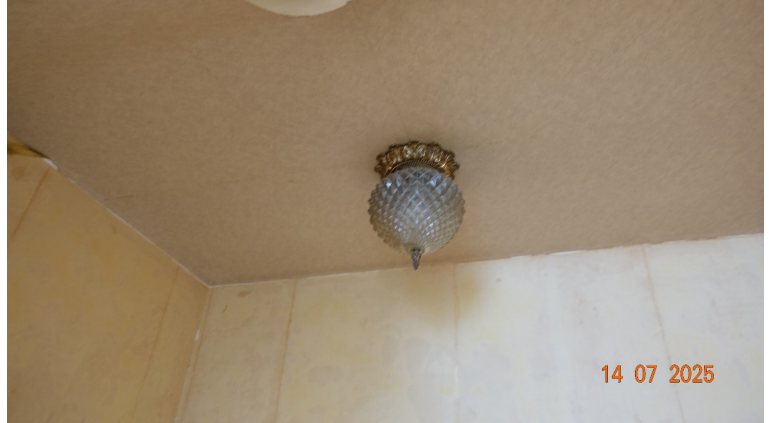
14. Plafond du palier du 2ème étage