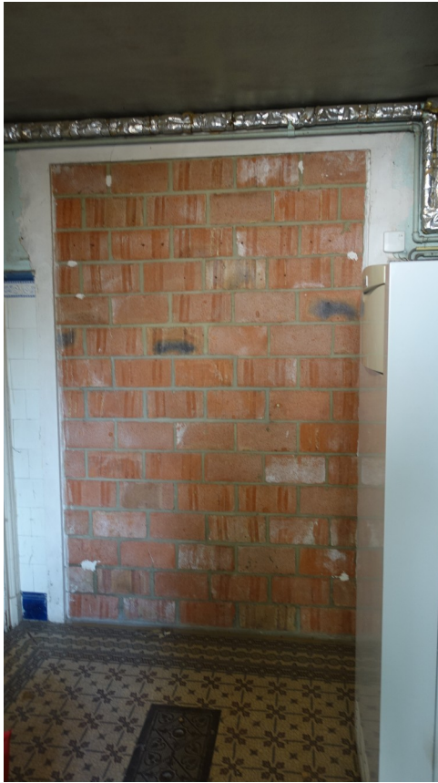
53. Baie comblée par les anciens propriétaires