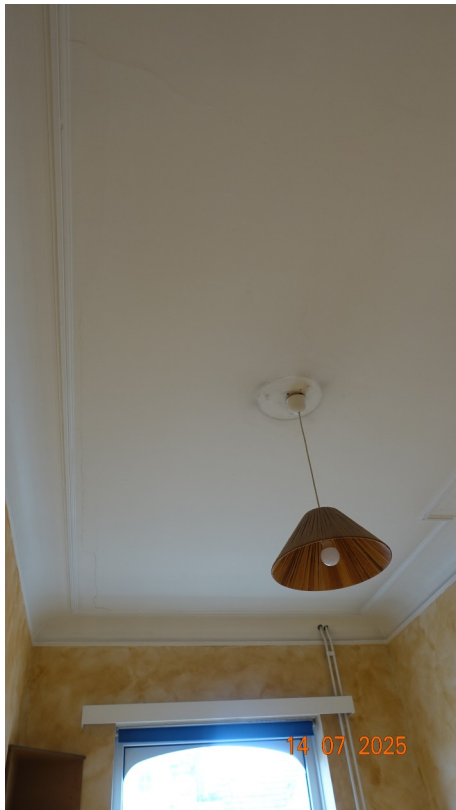
41. Chambre 2 (exi.)

◀ Moulures et corniche de plafond : conservées (si possible techniquement)