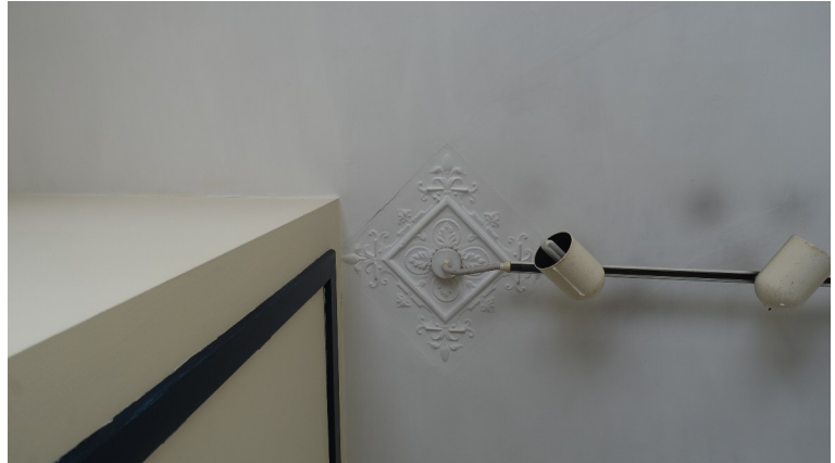
26. Rosace de plafond du Cabinet kiné (existant, pièce centrale)