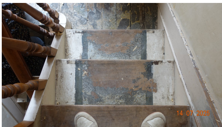
9. Marches d'escalier