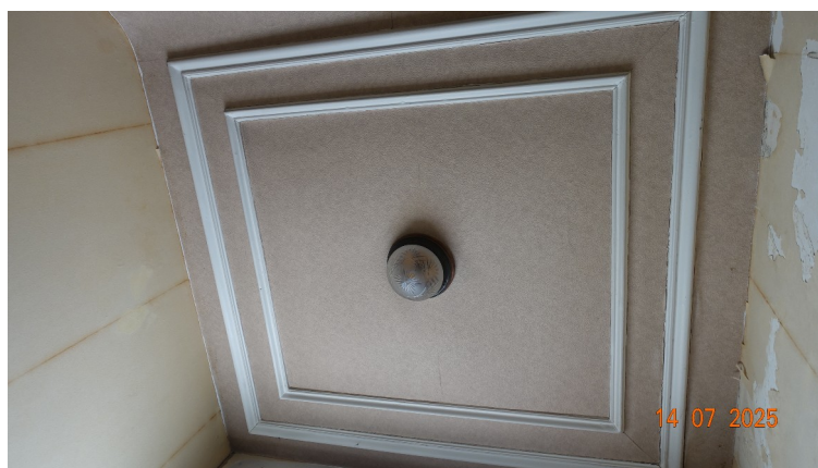
7. Plafond du hall d'entrée

◀ ▲ Moulure de plafond : conservées Porte : remplacée par une nouvelle porte avec dessin en ferronnerie Garde-corps en fer forgé : restauré