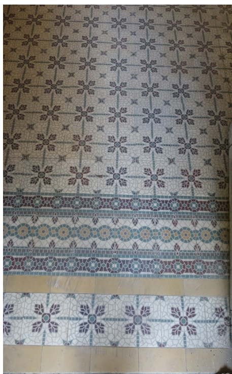
51. Carreaux de ciment (sol chaufferie)