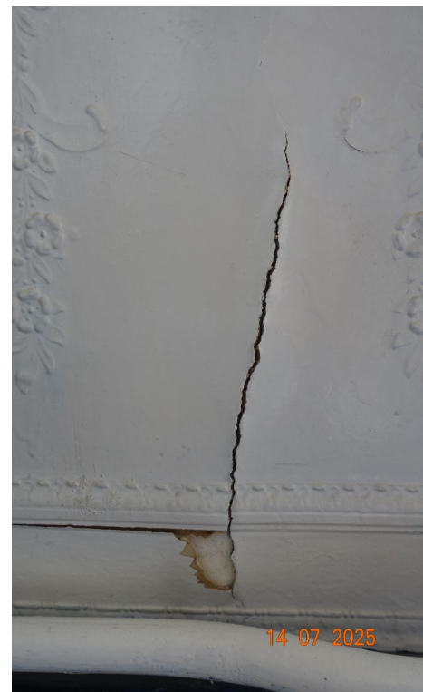
32. Décors de bas de mur Cabinet Kiné

Les décors sont réalisés avec la technique du carton moulé avec motifs en reliefs. Ils sont malheureusement en mauvais état, repeints, ils présentent des fissures et des décollements. Ils ont été partiellement endommagés lors des travaux d'aménagement du cabinet kiné et ne sont plus complets à l'état actuel. Les décors présents sur la façade arrière ont également souffert de l'humidité. Étant incomplets, le projet prévoit leur dépose et envisage leur repose à un autre endroit de la maison qui sera déterminé après dépose (quantité d'éléments complet non connue à ce stade). Nous appliquerons la même démarche à propos des cimaises en bois.