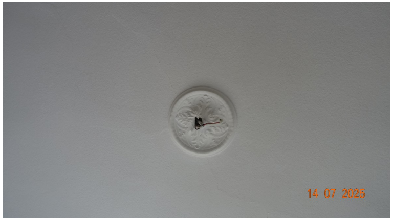
38. Rosace du plafond du salon