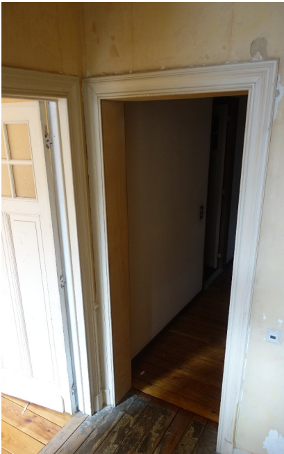
19. Porte 2ème étage Porte absente.