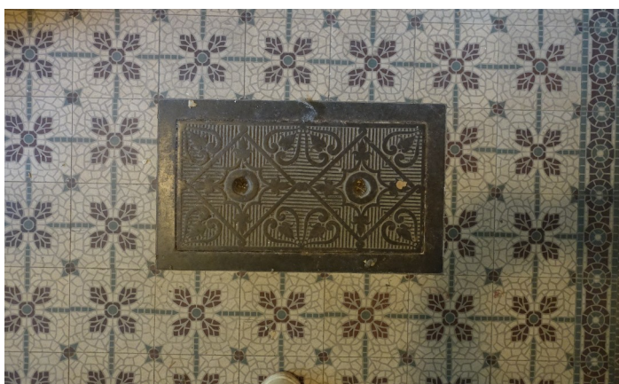
52. Taque de sol chaufferie

◀ ▲ Carreaux de ciment : conservés Taque : conservée