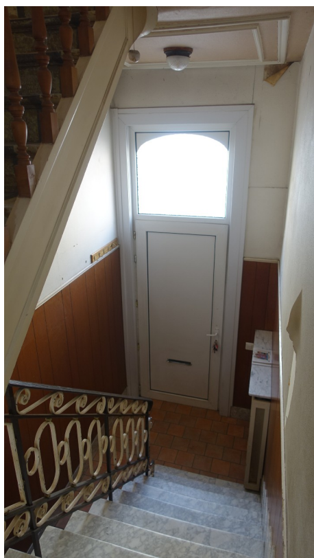
6. Hall d'entrée

▶ Marbre : conservé Garde-corps : conservé Poteau de départ : conservé Lambris : supprimé