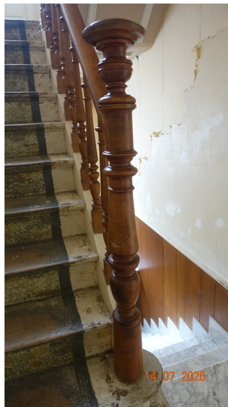
5. Poteau de départ

◀ Marbre : conservé Garde-corps : conservé Lambris : supprimé Cimaise de plafond : conservées Moulures sur paillasse d'escalier : conservées